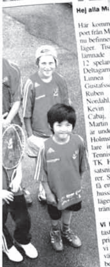
Hej alla Mi

- Det är hårt med utslagning i så tidig ålder, barn i åldrarna 10-16 är så olika varandra för några börjar växa tidigt och